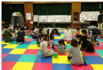
↑ みんなでおしゃべり 交流タイム