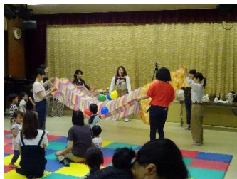
↑ 音楽に合わせて布&風船あそび